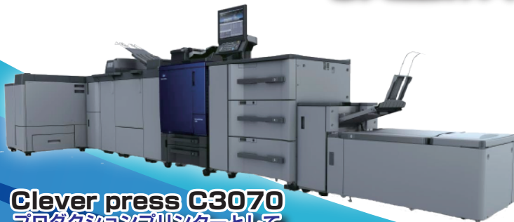
Clever press C3070